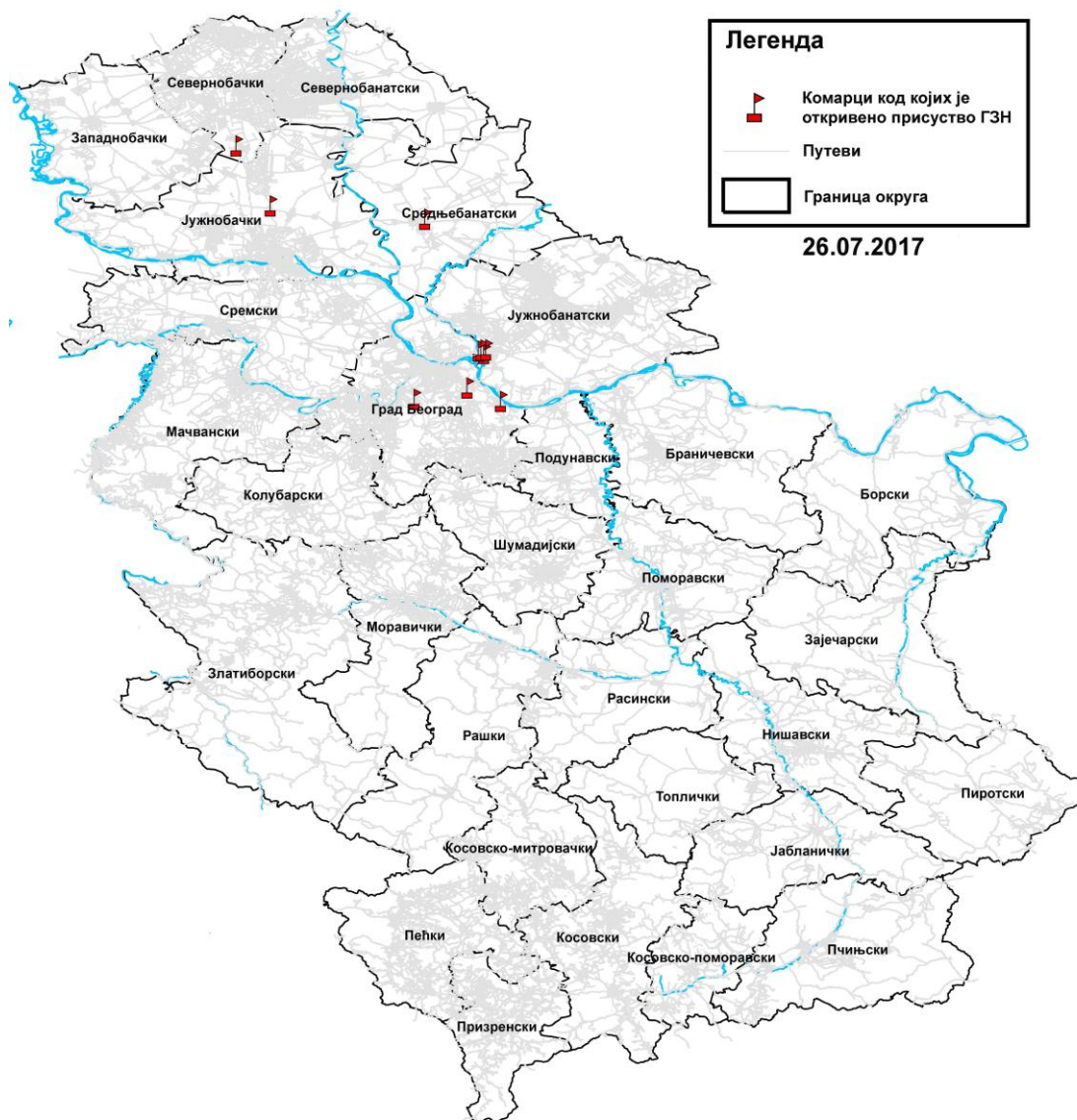
Мапа 3. Присуство вируса Западног Нила у узорцима комараца, Република Србија, сезона надзора 2017. години

Инфекција вирусом Западног Нила је званично први пут регистрована у хуманој популацији на територији Републике Србије крајем јула месеца 2012. године.